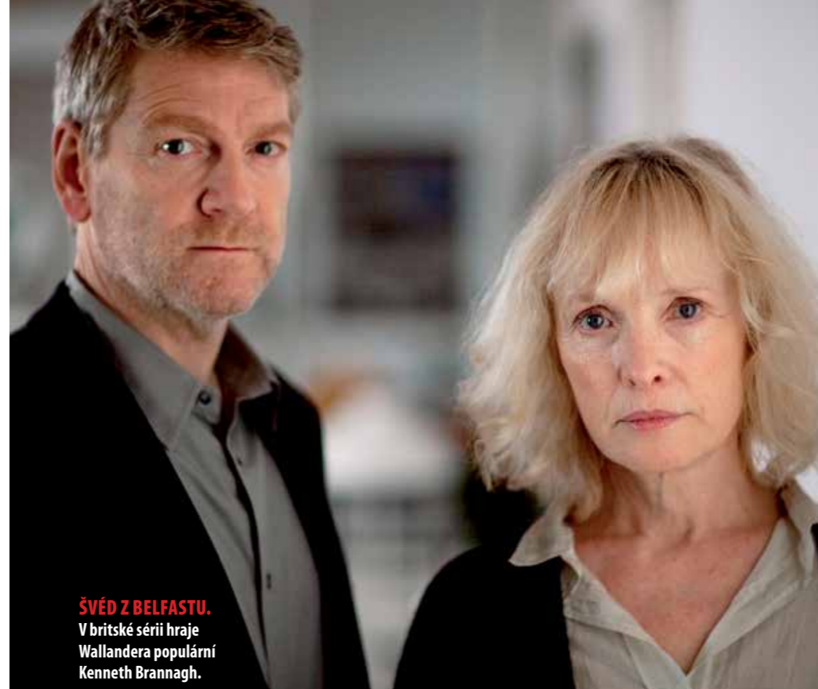
ŠVÉD Z BELFASTU. V britské sérii hraje Wallandera populární Kenneth Branagh.

OBCHODNÍK S DEPRESÍ. Henning Mankell dosáhl ke své sérii o rozmrzelém Kurtu Wallanderovi mimořádného komerčního úspěchu.