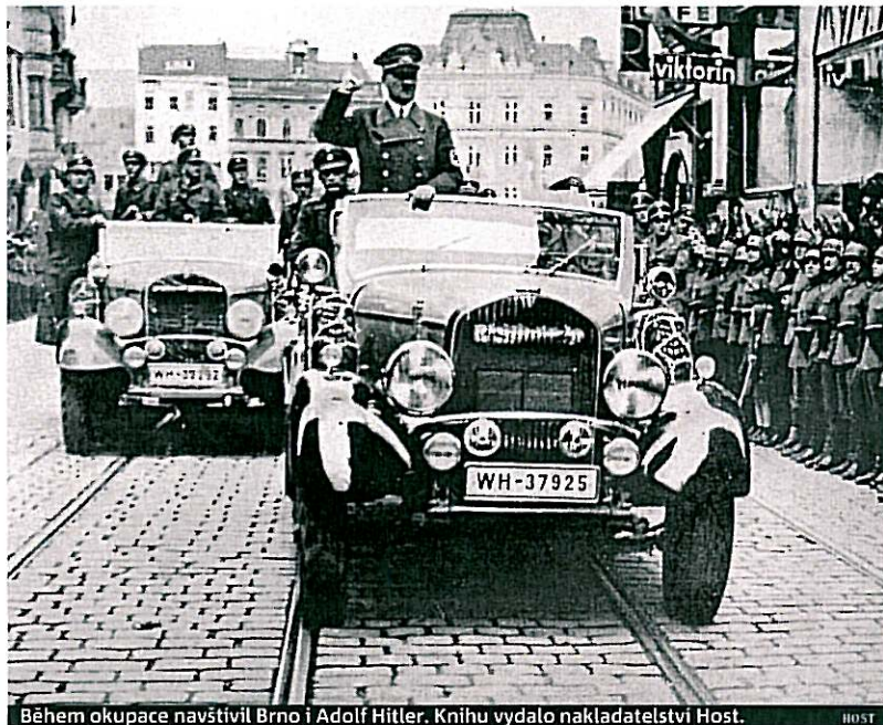
Během okupace navštívil Brno i Adolf Hitler. Knihu vydalo nakladatelství Host.