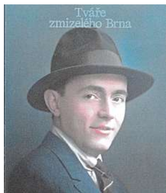
Tváře zmizelého Brna Sbírkou kolorovaných fotografií obětí holokaustu se zasvěceným úvodem vydalo nakladatelství Werk Publishing. Cena: 550 Kč

jem o jejich společenském zařazení a místem i přibližným datem zavraždění předchází Konečného historický vhled zabývající se místním antisemitismem, nacistickým pronásledováním Židů v Brně a jejich deportacemi do likvidačních koncentráků. „Neustálé připomínání těchto událostí a obětí může být jednou z možností, jak podobným tragédiím do budoucna zabránit, a je proto naší povinností,“ končí autor svoji zasvěcenou předmluvu.