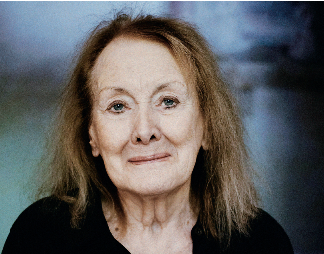
Annie Ernauxová pokračuje v literárních ohlédnutích za klíčovými okamžiky svého života