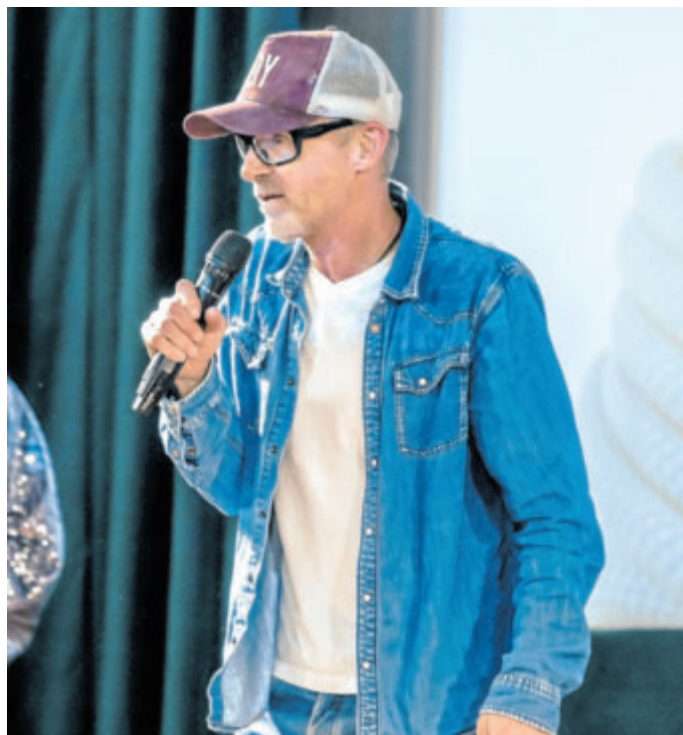
JO NESBØ při loňské návštěvě Česka.

Spisovatel, ale i rocker, který hraje na kytaru, se při utváření charakteru svého zasmušilého kriminalisty