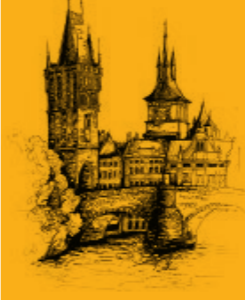
Samantha si Prahu velmi oblíbila a hodlá ji víc zapojit do svých příběhů.

„Většina pátého dílu série Kostičas se bude odehrávat v Itálii, ale částečně taky v Praze, protože mám tohle město moc ráda a chtěla jsem, aby se do něj Paige vypravila. Organizace Domino, která hrála ve čtvrtém díle velkou roli, má totiž jedno z ústředí právě v Praze. Tato její odnož se jmenuje Libuše. Zkoumala jsem totiž dějiny věstců a orákul a přišlo mi zábavné, že Praha byla podle legend vlastně založena ženou, kněžnou, která měla vizi, viděla Prahu v budoucnosti – a tak jsem ji chtěla do příběhu zahrnout. Objeví se také postava s českým původem jménem Veronika, která Paige a jejím spolebojovníkům významně pomůže.“