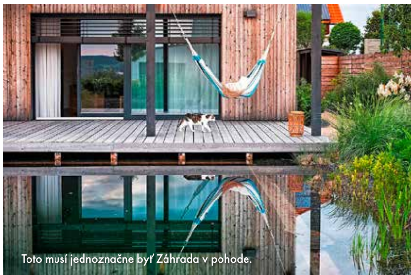
Toto musí jednoznačne byť Záhrada v pohode.