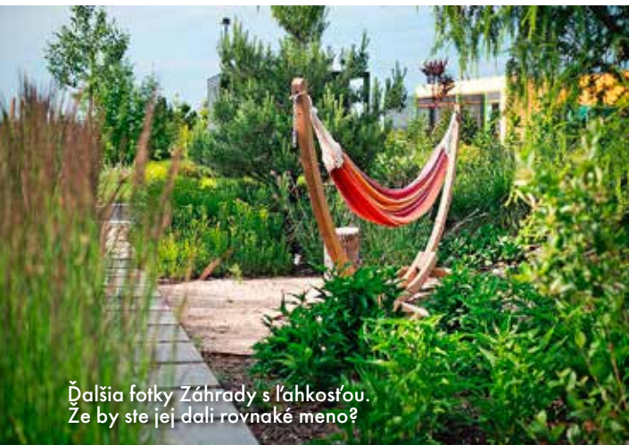
Ďalšia fotky Záhrady s ľahkosťou. Že by ste jej dali rovnaké meno?