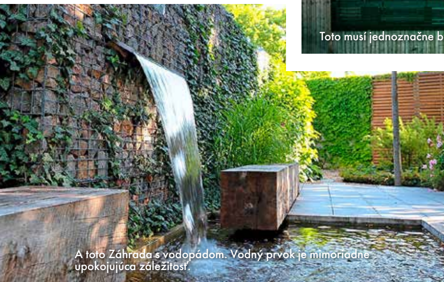
A toto Záhrada s vodopádom. Vodný prvok je mimoriadne upokojujúca záležitosť.