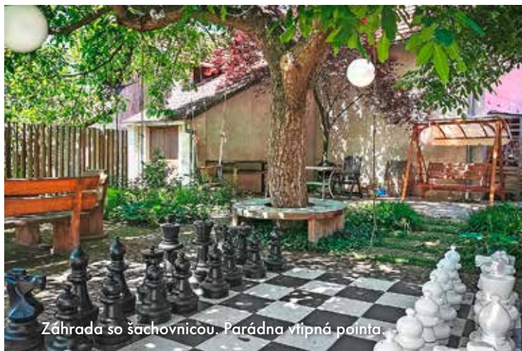
Záhrada so šachovnicou. Parádna vtipná pointa.

sa stane pointou záhrady. My síce ešte úplne presne nevieme, ako bude vyzeráť tá naša, ale pointu aj názov už máme. Chceme Záhradu, kde to žije. Alebo Záhradu u veselej madam? Oboje! Nebudeme predsa „šidiť“ svoje sny. ME