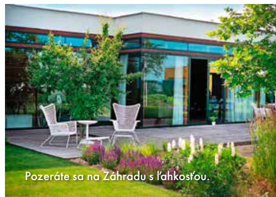
Pozeráte sa na Záhradu s ľahkosťou.