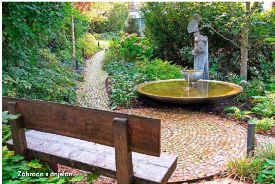
Záhrada s anjelom.

Keď sme si pozerali fotografie záhrad, ktoré vytvoril ateliér Flera, zaujalo nás, že každá mala meno. Záhrada pre čmeliaky, Záhrada pre otužilcov, Záhrada so žabkou. V tom je ten vtíp: nájsť niečo, čo