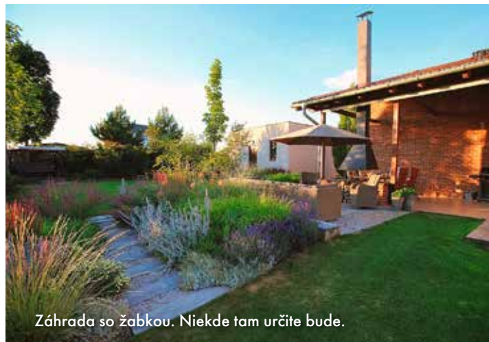
Záhrada so žabkou. Niekde tam určite bude.

rozdeliť si projekt do viacerých fáz a realizovať ich postupne, až keď na ne budeme mať, a použil pri tom výraz „nešidte své sny“, boli sme lapané.