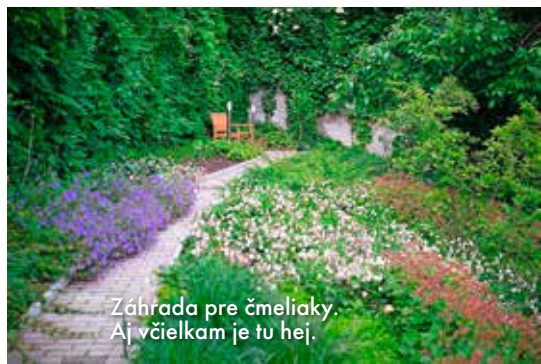
Záhrada pre čmeliaky. Aj včielkam je tu hej.