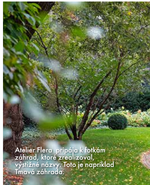
Atelier Flera pripája k fotkám záhrad, ktoré zrealizoval, výstižné názvy. Toto je napríklad Tmavá záhrada.