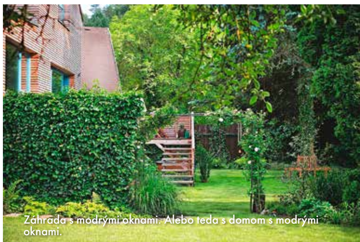
Záhrada s modrými oknami. Alebo teda s domom s modrými oknami.