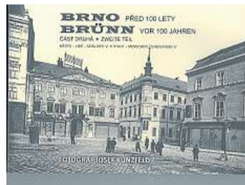
Brno před sto lety, část II. Josef Kunzfeld, Nakladatelství Josef Filip, 735 Kč

další výběr z prací talentovaného dokumentátora. Takže chcete-li nahlédnout, jak to v centru Brna a na jeho hlavních výpadovkách vypadalo před i během přestavby a také krátce po ní už s novými paláci a domy, nově vydaná kniha vás provede jak současným centrem či dnešními ulicemi Vídeňská, Křenová a dalšími, ale také vám ukáže třeba interiéry městských jatek, prachárny na Kraví hoře, malebné uličky Starého Brna i nově stavěné mosty přes Svratku v Pisárkách. Perličkami jsou pohledy na zaniklý hřbitov ve Vídeňské i nově vznikající Ústřední hřbitov a pak slavnosti zahájení staveb, provozu elektrické tramvaje či výstavby březovského vodovodu. Na závěr se můžete pokochat i několika celkovými pohledy na Brno, které dnes už vypa- dají docela jinak.