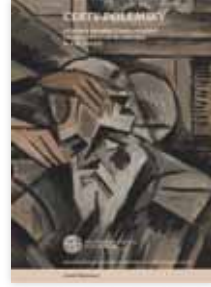
Luboš Merhaut Cesty polemiky FF UK 2021, 475 s.

Cílem monografie s podtitulem Význam a proměny žánru polemiky v české literatuře na přelomu 19. a 20. století je představit polemiku jakožto svébytný přesvědčovací a rétorický útvar. Autor ji vidí nejen coby formu debaty, ale také jako způsob, jak pokořit a zesměšnit protivníka. Ve sledovaném období jsou polemiky a osobní útoky vskutku vyostřenější než v současném literárním prostředí. Polemika je však také nazírána jako samoučelná parazitní forma diskuse, která může být spíše překážkou na cestě k „pravdě“ než prostředkem jejího hledání. Ustavení žánru jde ruku v ruce s literární kritikou – také ta získala na vážnosti a přestala být přehlíženou disciplínou teprve v devadesátých letech 19. století. Nejžurnivější spory se přitom literatury týkaly jen okrajově: například při hodnocení odkazu Jana Nerudy bylo hlavním motivem to, že byl „vlažný křesťan“ a útočil na katolictví. Podobně je na řadě vzpomínek Jiřího Karáska ze Lvovic doloženo, že proslulé polemiky mezi Arnoštem Procházkou a F. X. Šaldou měly kořeny v osobních antipatiích a snaze ovládnout Literární listy. V teoretické rovině je nosný Merhautův pojem „paměť polemiky“. Polemika se vnitřně vrství, stává se svým vlastním předmětem a dochází k jejímu zacyklení. Předností knihy je i zasazení žánru do širokého společenského kontextu s návazností na literární život či dobový rozmach časopisů. Pro literární badatele je cenný i přehled devadesáti polemických kauz probíhajících v letech 1886 až 1914.