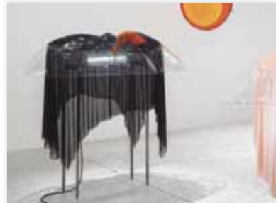
Digitální blízkost / Post-digital Intimacy Národní galerie Praha, Veletržní palác, 11. 11. 2021 – 10. 7. 2022