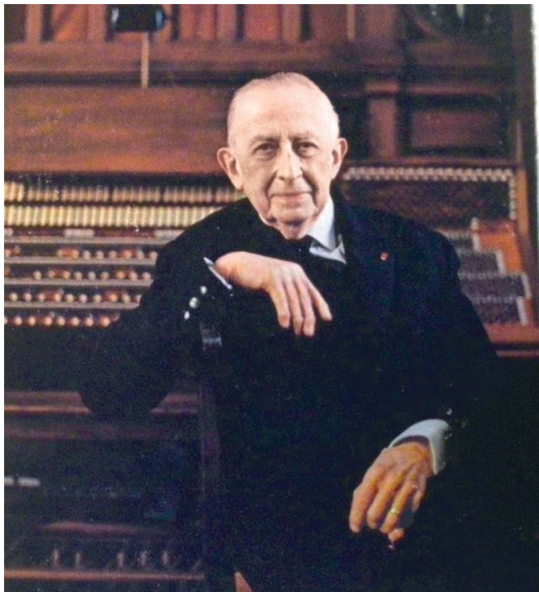
Letos si hudební svět připomíná půlstoletí od smrti významného francouzského komponisty a varhaníka Marcela Duprého (1886–1971). Desítky let byl titulárním varhaníkem chrámu sv. Sulpicia v Paříži, kde je také zachycen na tomto nedatovaném snímku.

53. Mezinárodní varhanní festival Olomouc. 2.–16. 9. 2021, program a vstupenky na www.mfo.cz