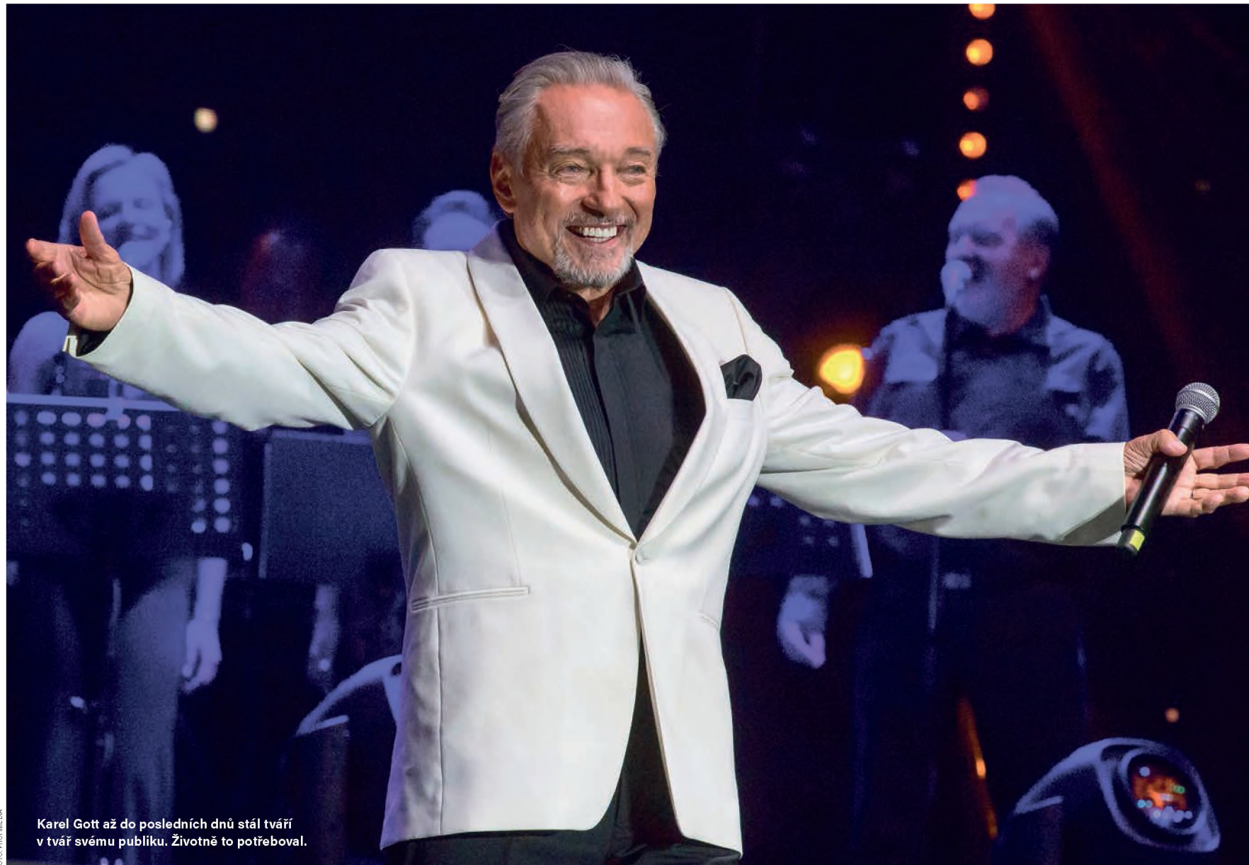
Karel Gott až do posledních dnů stál tvář v tvář svému publiku. Životně to potřeboval.

Podnikl jsem experiment několikahodinového rozsahu. V těsném sousedství jsem na sebe nechal působit Klusákovu čtyřsetstránkovou knihu, snažící se demytizovat zpěvákův život na základě dohledaných historických pramenů,