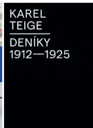
Deníky 1912–1925, Karel Teige Akropolis, Praha 2022

tuální zrání zachycuje soubor Deníků z let 1912–1925, které jej zastihují coby studenta osmiletého gymnázia v Křemencově ulici v Praze. Takřka každý deníkový zápis doprovází komentář, a tak se leccos dozvíme i o tehdejší školství. Třeba že roku 1915 nahradila tělesnou výchovu předvojenská příprava žáků, tzv. junobrana.